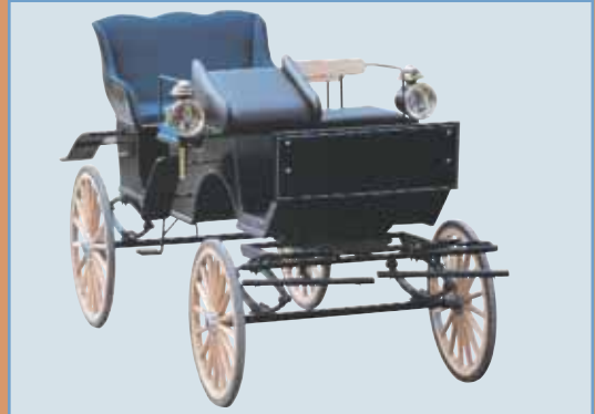
Art.0004. 6 seters Jaktvogn. Meget populær for bryllupskjøring og annen form for finkjøring. Leveres med gummibelagte trehjul, heleptiske fjærer og hydr.skivebrems. Vognen er meget behagelig å kjøre. Leveres som enspenner og for parkjøring.