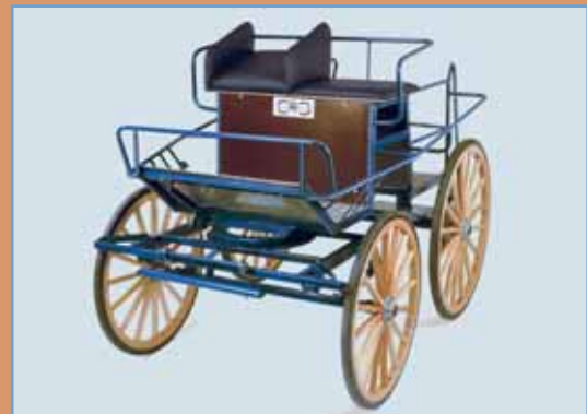
Art.0009B. Enspenner marathonvogn. Leveres med hydr. skivebrems bak, halveptiske fjærer og alternative hjul, både i størrelse og materiale. Variert utstyrsnivå.