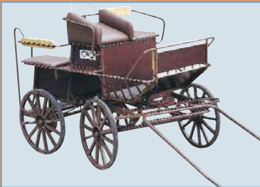
Art.0010. 4-hjuls marathonvogn. Det er plass til 4 personer og egner seg ypperlig for trening og turkjøring. Leveres med stålhjul og hydr. skivebrems på bakaksel.