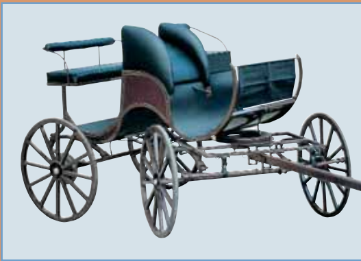
Art.0005. Elegant firehjuls presentasjonsvogn for enspenner og par. Vognen har hevdet seg godt i konkurranser både i Sverige og Norge. Vognen har gummibelagte trad.hjul i tre/stål. Og utstyrt med hydr.skivebrems bak.