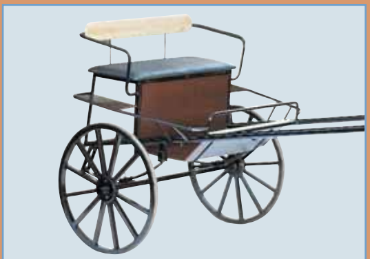
Art.0013C. Treningsgig. Leveres med trad. gummibelagte stålhjul og halveptiske fjærer, fendere, skjerm, piskeholder og stigtrinn. Dette er en robust treningsgig med god avfjæring og god sittehøyde som gjør at du får god oversikt.