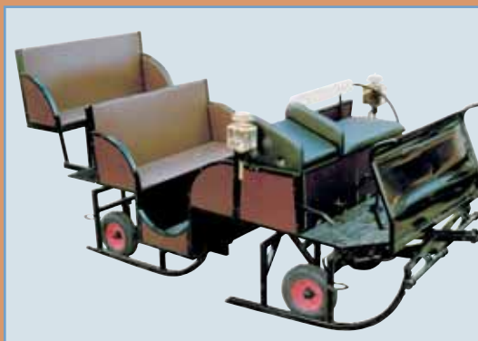
Art.0007. Slede med hydrauliske nedsenkbare hjul. Den har plass til 12 personer. Bakre sete kan tas av og på etter behov. Leveres med hydr.brems, låsebolt for svingkrans, hydr. parkbrems og utstyr for parkjøring.