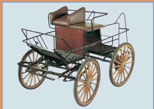
Art. 0009C. Enspenner marathonvogn. Dette er den samme som Art.0009, men med heleptisk avfjæring.