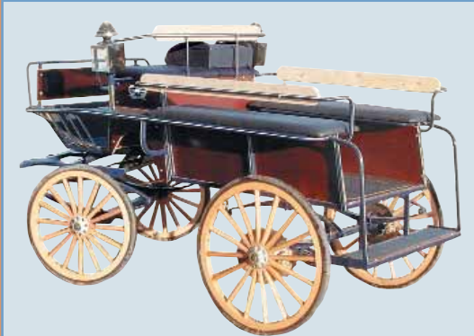
Art.0011A. Charabanc. Bildet viser en 8 seter, den kan leveres i flere størrelser. Egner seg ypperlig til kommersiell kjøring av turister og selskaper. Det er lett av- og påstigning for passasjerer. Vognen har hydr. skivebrems bak og hydr. parkeringsbrems, heleptiske fjærer. Hjul leveres i stål el. tre.